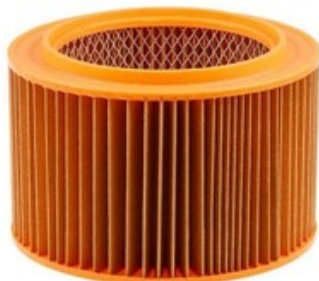
Filtrační patrona - válcový filtr Gisowatt PC 50 - PC 70