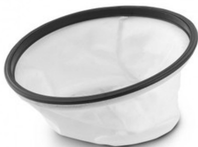
Filtrační vak Gisowatt PC 50 - PC 70 INOX