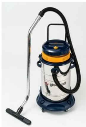
Gisowatt PC 70 Inox