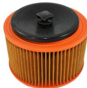
Filtrační patrona - válcový filtr s držákem Gisowatt PC 50 - PC 70