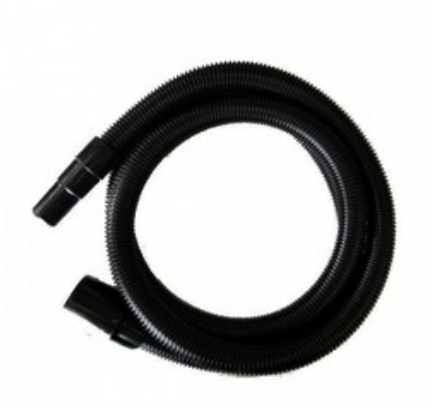
Gisowatt sací hadice včetně konevek pro vysavače DN 25 x 3m