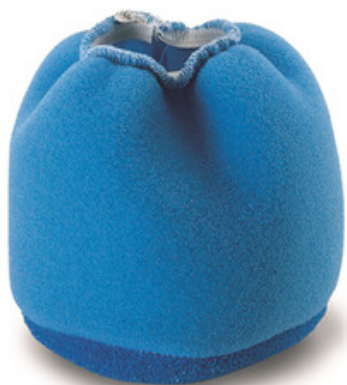
Vodní filtr pro vysavače Gisowatt - malý