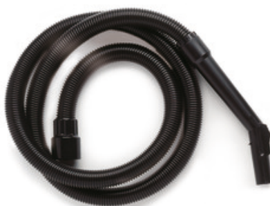
Kompletní sací hadice pro vysavače Gisowatt - 1.7m DN36