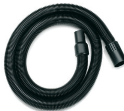
Kompletní sací hadice pro vysavače Gisowatt - 1.7m DN45