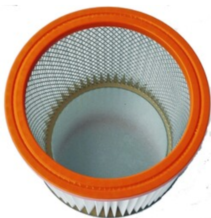
Filtrační patrona - válcový filtr Gisowatt "M" Polyester