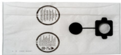
Filtrační sáčky Gisowatt PC 20 - PC 35 "M" fleece (5ks)