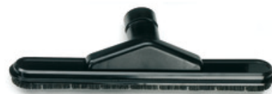
Průmyslová podlahová hubice se štětinami Gisowatt DN45