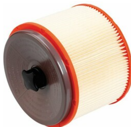
Válcový filtr s držákem Gisowatt pro třídu prachu "H"