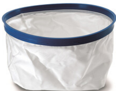
Filtrační vak Gisowatt PC 35 - PC 50 Plastic