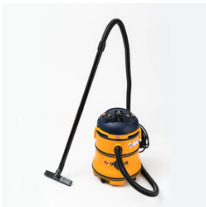
Gisowatt PC 35 Tools Autoclean H