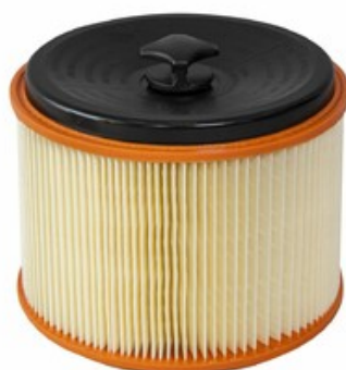
Filtrační patrona - válcový filtr s držákem Gisowatt PC 35 - PC 50 "M"