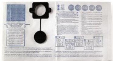
Filtrační sáčky Gisowatt PC 20 - PC 25 (5ks)