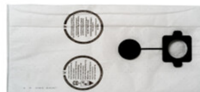
Filtrační sáčky Gisowatt PC 20 - PC 35 "M" fleecy (5ks)