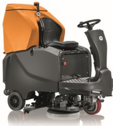
TSM Grande Brio Ride ON 145-850