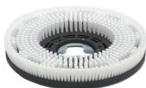
Diskový kartáč TSM 500mm PPL 0,6 (Ride ON 145-1000)