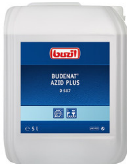
Buzil Budenat Azid Plus D 587 (5L)