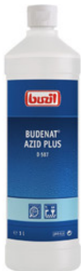
Buzil Budenat Azid Plus D 587 (1L)