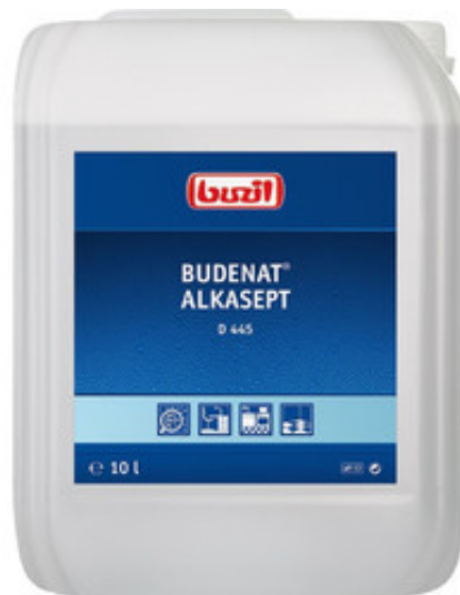
Buzil Budenat Alkasept D 445 (10L)