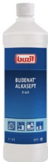
Buzil Budenat Alkasept D 445 (1L)