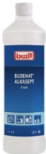
Buzil Budenat Alkasept D 445 (1L)