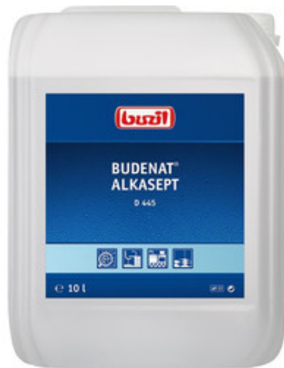
Buzil Budenat Alkasept D 445 (10L)