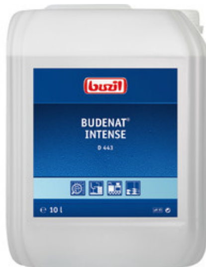
Buzil Budenat Intense D 443 (10L)