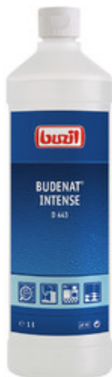
Buzil Budenat Intense D 443 (1L)