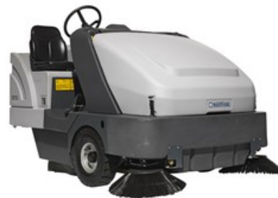
Nilfisk SR 1601 LPG3