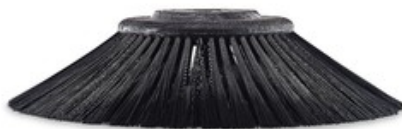
Boční kartáč pro zametací stroje Nilfisk 300x500mm PPL 1.5