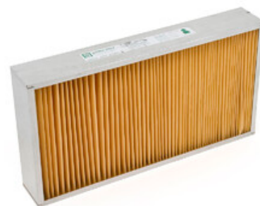
Papírový panelový filtr Ultra Web pro zametací stroje Nilfisk SR 1601 a SW8000