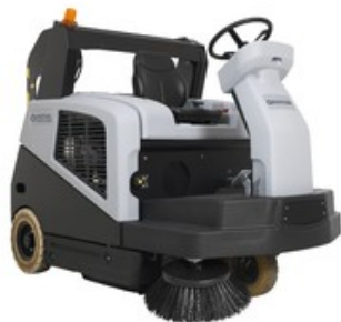
Nilfisk SW5500 LPG