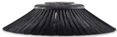
Boční kartáč pro zametací stroje Nilfisk 302x500mm PPL 1,5