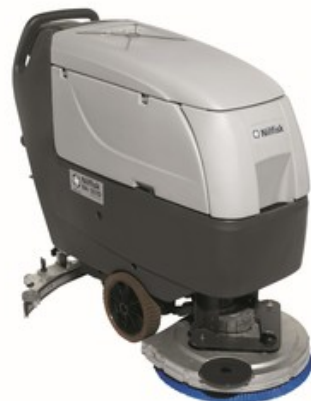
Nilfisk BA 551 D