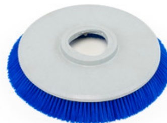
Diskový kartáč Nilfisk 305mm (12") - Prolene