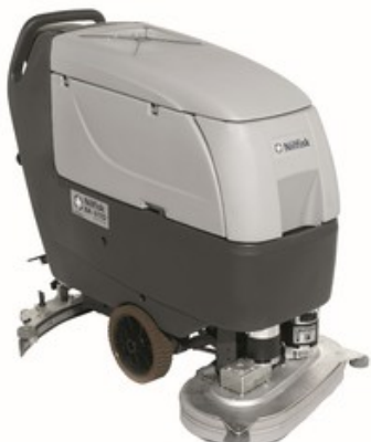
Nilfisk BA 611 D