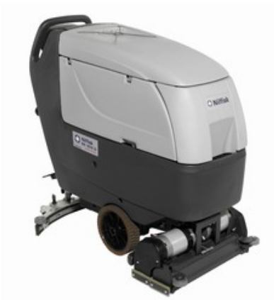
Nilfisk BA 551C D FULL PACKAGE