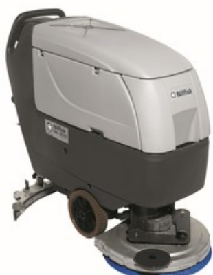
Nilfisk BA 551 D FULL PKG