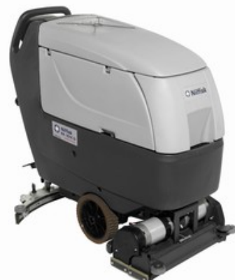
Nilfisk BA 551C D FULL PACKAGE