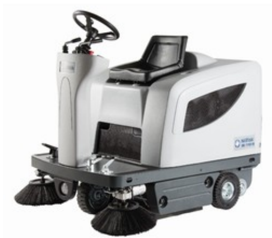
Nilfisk SR1101 B