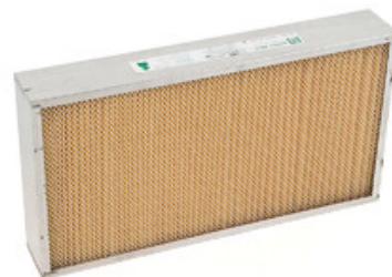
Papírový panelový filtr pro zametací stroje Nilfisk SR1101 / SR1301 a Floortec R 670 / R 680