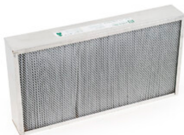
Antistatický polyesterový panelový filtr pro zametací stroje Nilfisk SR1101 / SR1301 a Floortec R 670 / R 680