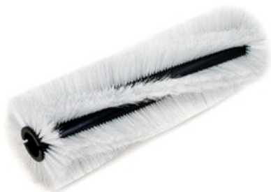
Hlavní válcový kartáč pro zametací stroje Nilfisk 300x700mm PPL 0,5-0,7