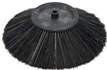
Boční kartáč pro zametací stroje Nilfisk 180x400mm Mix steel