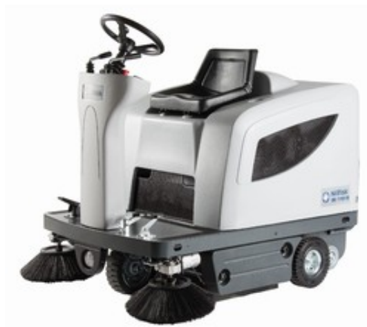
Nilfisk SR1101 P