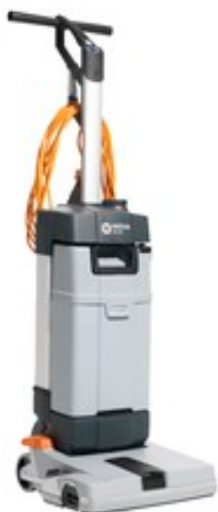
Nilfisk SC100 E