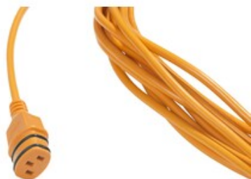
Přívodní napájecí kabel Nilfisk SC100 a SCRUBTEC 130 E (15m)