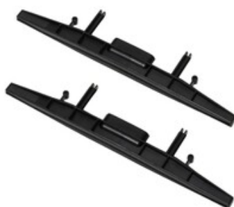
Sada sacích lišt na čištění koberců pro Nilfisk SCRUBTEC 130 E a SC100