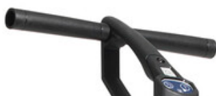
Madlo pro obouruční ovládání Nilfisk SC100 a SCRUBTEC 130 E