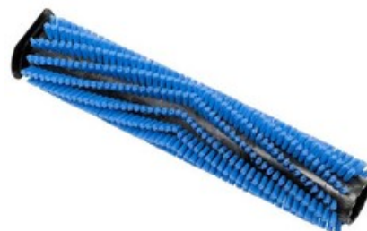
Válcový kartáč na koberce pro Nilfisk SCRUBTEC 130 E (SC100)