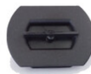
Zámek kartáče Nilfisk SC100 a SCRUBTEC 130 E