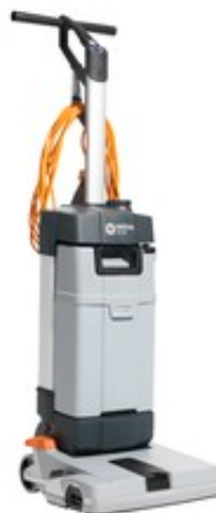
Nilfisk SC100 E FULL PACKAGE