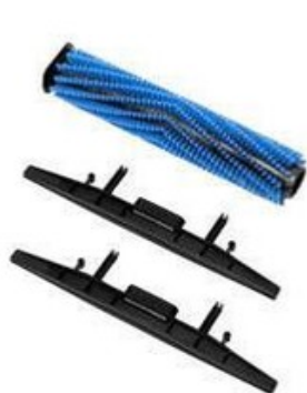
Kompletní sada pro extrakci Nilfisk SCRUBTEC 130 E (SC100)