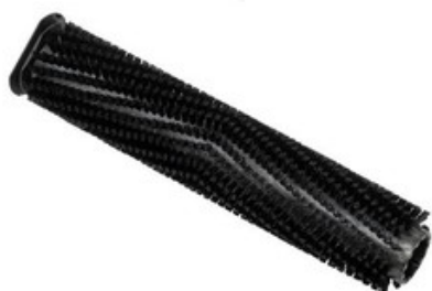
Válcový kartáč tvrdý pro Nilfisk SCRUBTEC 130 E (SC100)