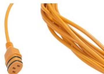
Přívodní napájecí kabel Nilfisk SC100 a SCRUBTEC 130 E (10m)