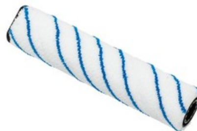
Válcový kartáč mikrovláknový pro Nilfisk SCRUBTEC 130 E (SC100)