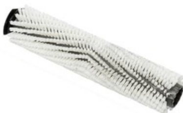
Válcový kartáč střední-standard pro Nilfisk SCRUBTEC 130 E (SC100)