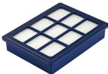
Nilfisk HEPA filtr H13 pro vysavače Nilfisk