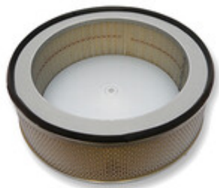
Absolutní HEPA filtr H14 D500 pro průmyslové vysavače EVOTEC (2,0 m 2 )