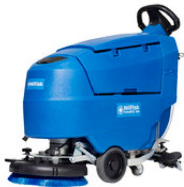
Nilfisk SCRUBTEC 344 E