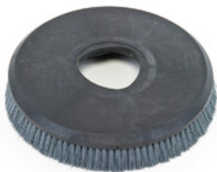
Diskový kartáč Nilfisk 430mm (17") - Union Mix