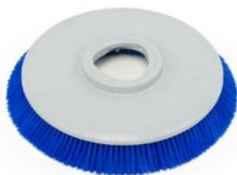
Diskový kartáč Nilfisk 430mm (17") - Prolene