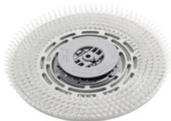
Držák padu se zámkem Nilfisk 430mm (17")