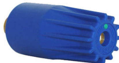
Rotační tryska vysokotlaká Mazzoni 045