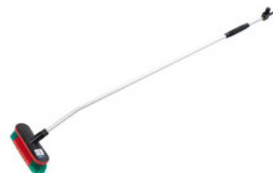
Nilfisk průtočný mycí kartáč s nástavcem 1550mm