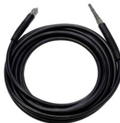
Čistič potrubí pro vysokotlaké čističe Nilfisk 20M (06)