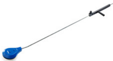
Nilfisk rotační kartáč s tryskou 065 a nástavcem 1700mm