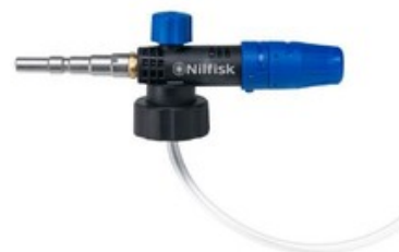
Nilfisk napěňovací nástavec Vario (960-1440 l/hod)