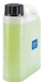
Nádobka pro napěňovací nástavec Nilfisk Vario (2,5L)