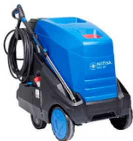
Nilfisk MH 6P-200/1300 FAX