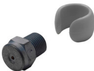
Vysokotlaká tryska Nilfisk Tornado Plus 0680