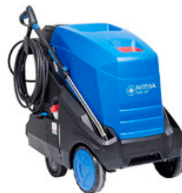
Nilfisk MH 6P-200/1300 FA