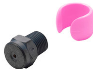
Vysokotlaká tryska Nilfisk Tornado Plus 0750