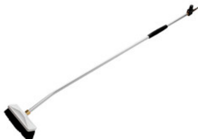
Nilfisk průtočný mycí kartáč s nástavcem 2350mm