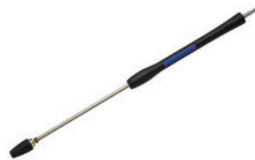
Nilfisk Turbokladivo Plus nástavec - 1040mm (0700) W11