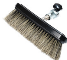
Nilfisk průtočný mycí kartáč