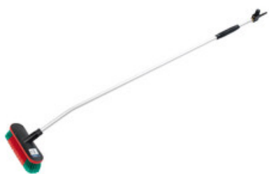
Nilfisk průtočný mycí kartáč s nástavcem 1550mm