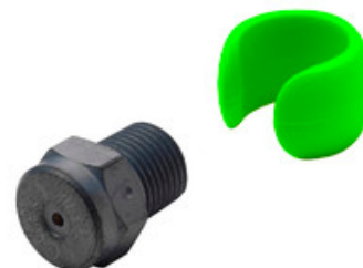
Vysokotlaká tryska Nilfisk Tornado Plus 0550