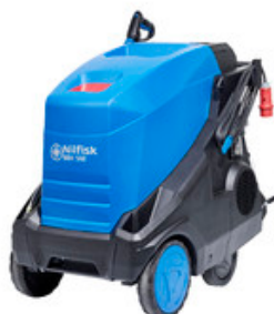
Nilfisk MH 5M-200/960 FA