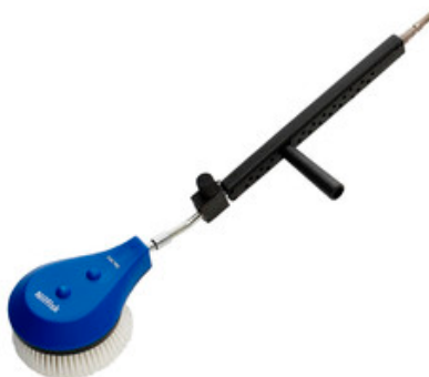
Nilfisk rotační kartáč s tryskou 055 a nástavcem 800mm