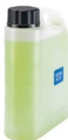
Nádobka pro napěňovací nástavec Nilfisk Vario (2,5L)