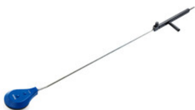
Nilfisk rotační kartáč s tryskou 055 a nástavcem 1700mm