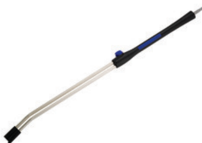
Nilfisk Tornado Plus nástavec - 1120mm