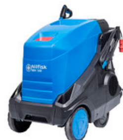
Nilfisk MH 5M-200/960 FAX