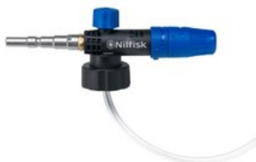
Nilfisk napěňovací nástavec Vario (960-1440 l/hod)