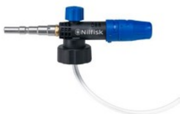
Nilfisk napěňovací nástavec Vario (960-1440 l/hod)