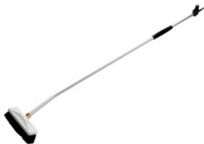
Nilfisk průtočný mycí kartáč s nástavcem 2350mm