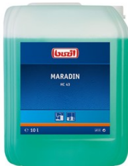
Buzil Maradin HC 43 (10L)