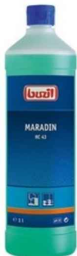
Buzil Maradin HC 43 (1L)