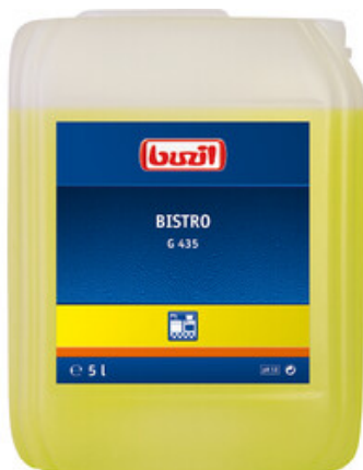
Buzil Bistro G 435 (5L)