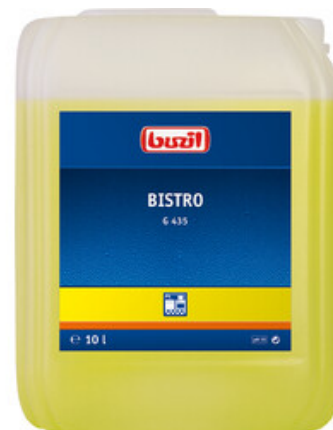
Buzil Bistro G 435 (10L)