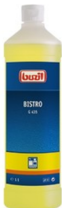
Buzil Bistro G 435 (1L)