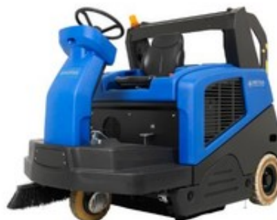
Nilfisk FLOORTEC R 985 LPG