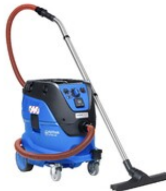
Nilfisk ATTIX 44-2H IC