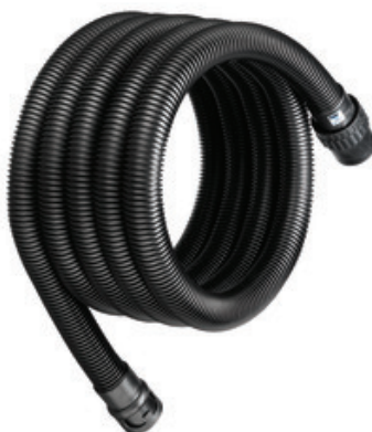
Sací hadice včetně koncovek pro vysavače Nilfisk ATTIX - DN 36 x 5m - Antistatická