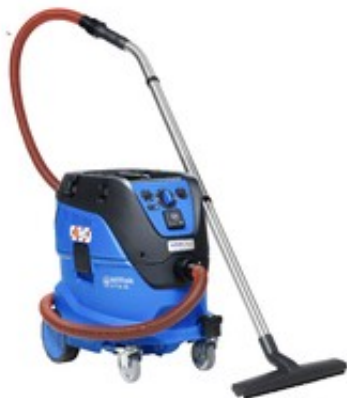
Nilfisk ATTIX 44-2M IC