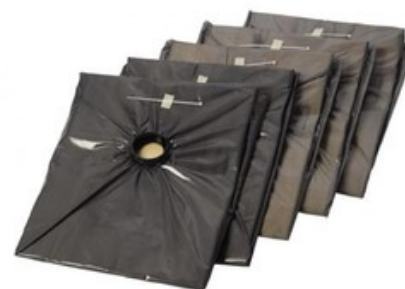
Bezpečnostní sáčky pro Nilfisk ATTIX 33 H - ATTIX 44 H (5ks)