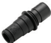
Adaptér na nářadí pro vysavače Nilfisk Quicksystem/DN36-24