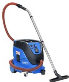
Nilfisk ATTIX 33-2M PC