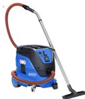
Nilfisk ATTIX 33-2H PC