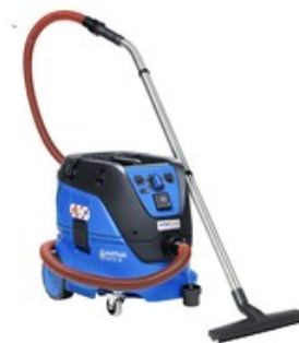
Nilfisk ATTIX 33-2M IC