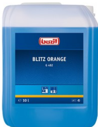
Buzil Blitz Orange G 482 (10L)