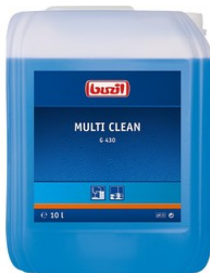
Buzil Multi Clean G 430 (10L)