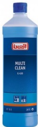
Buzil Multi Clean G 430 (1L)