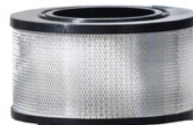
Nilfisk HEPA filtr pro vysavače ATTIX 145x75mm (H-CLASS)