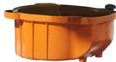
Kryt HEPA filtru pro vysavače ATTIX 33 a ATTIX 44