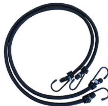
Flexibilní upínací guma "pavouk" pro vysavače Nilfisk ATTIX 33 a ATTIX 44 (2ks)