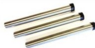
Nilfisk prodlužovací trubky pro vysavače 3x350mm - nerez DN 36