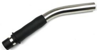
Ruční trubka zahnutá pro vysavače Nilfisk-ALTO ATTIX DN36 - nerez