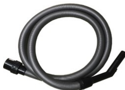
Sací hadice s hrdlem a ruční zahnutou trubkou pro vysavače Nilfisk ATTIX - DN 32 x 3m