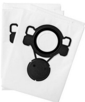
Nilfisk filtrační pytel FLEECE pro ATTIX 33, ATTIX 44 (5ks)