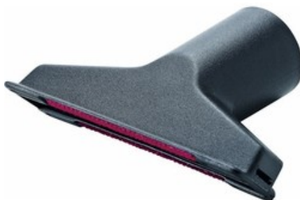
Sací hubice na čalounění Nilfisk DN36