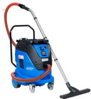
Nilfisk ATTIX 44-2L IC MOBILE