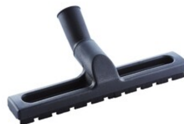
Nilfisk podlahová hubice pro suché vysávání DN36