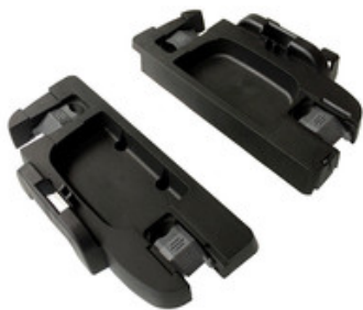
Nilfisk adaptér pro systém L-BOXX a TANOS