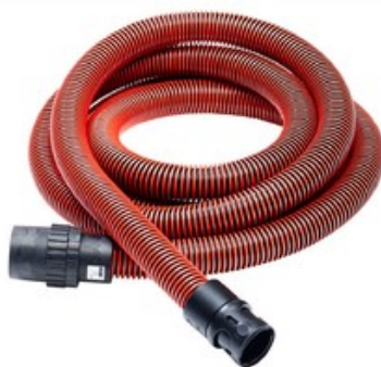
Antistatická sací hadice pro vysavače Nilfisk - DN 32 x 4m