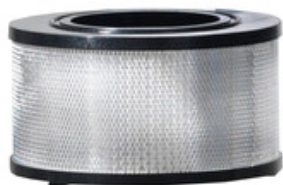
Nilfisk HEPA filtr pro vysavače ATTIX 145x75mm (H-CLASS)