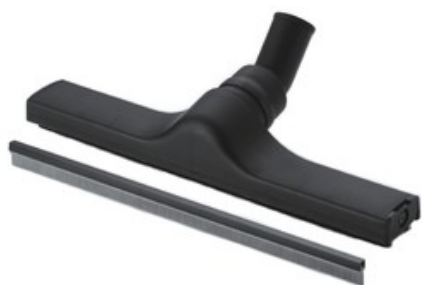
Nilfisk-ALTO podlahová hubice pro mokré i suché vysávání DN36 (400mm)