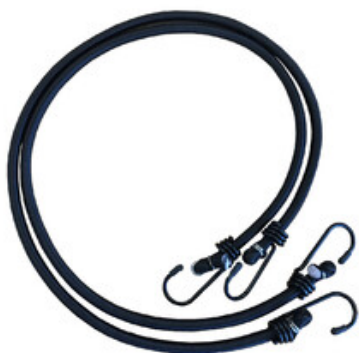
Flexibilní upínací guma "pavouk" pro vysavače Nilfisk ATTIX 33 a ATTIX 44 (2ks)