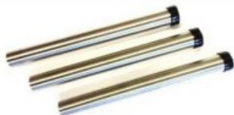
Nilfisk prodlužovací trubky pro vysavače 3x350mm - nerez DN 36