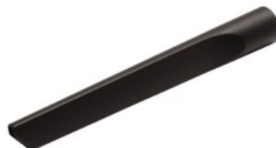
Štěrbínová hubice DN 36 pro vysavače Nilfisk-ALTO