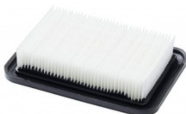
Hlavní PTFE filtr pro vysavače Nilfisk ATTIX 33 - ATTIX 44