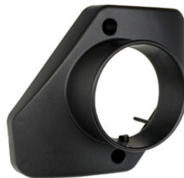
Nilfisk adaptér pro odvod vzduchu ATTIX 33, ATTIX 44