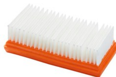
Filtr chlazení motoru pro vysavače Nilfisk ATTIX 33 - ATTIX 44