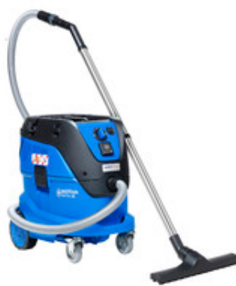
Nilfisk ATTIX 44-2L IC