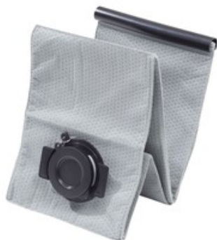
Nilfisk filtrační sáček pro opakované použití pro ATTIX 33, ATTIX 44 (1ks)