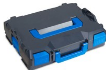
Nilfisk L-BOXX systém pro uložení příslušenství