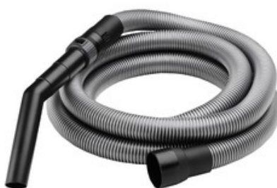
Sací hadice s hrdlem a ruční zahnutou trubicí pro vysavače Nilfisk ATTIX - DN 32 x 3,5m