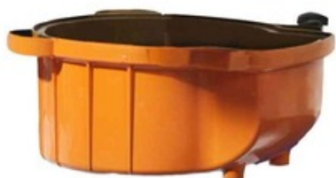
Kryt HEPA filtru pro vysavače ATTIX 33 a ATTIX 44