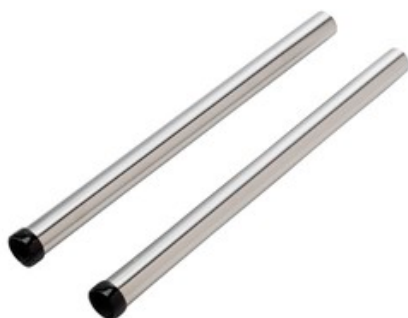
Nilfisk-ALTO prodlužovací trubky pro vysavače 2x500mm - nerez DN36