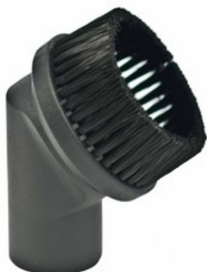
Sací kulatá hubice pro vysavače Nilfisk-ALTO DN 36