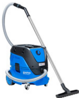
Nilfisk ATTIX 33-01 IC