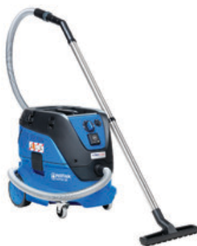
Nilfisk ATTIX 33-2L IC