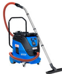
Nilfisk ATTIX 33-2L IC MOBILE