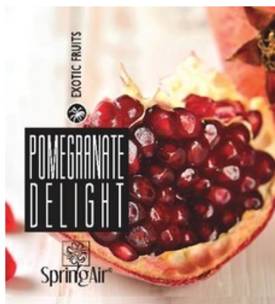
Náplň do velkoprostorového osvěžovače Spring Air (CryptoScent) - POMEGRANATE DELIGHT (1000ml)