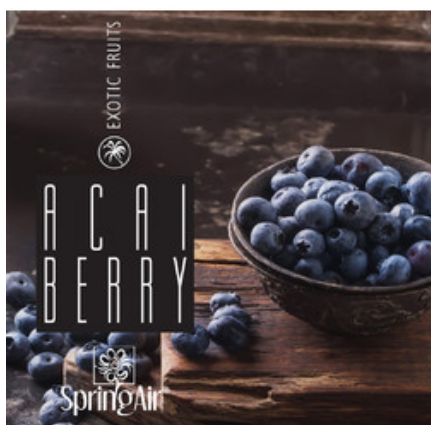
Náplň do velkoprostorového osvěžovače Spring Air (CryptoScent) - ACAI BERRY (1000ml)