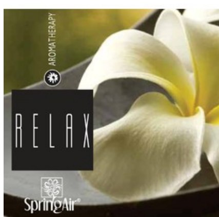
Náplň do velkoprostorového osvěžovače Spring Air (CryptoScent) - RELAX (1000ml)