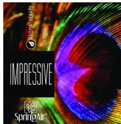
Náplň do velkoprostorového osvěžovače Spring Air (CryptoScent) - IMPRESSIVE (1000ml)