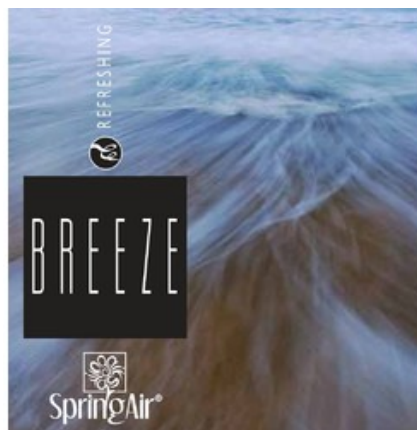
Náplň do velkoprostorového osvěžovače Spring Air (CryptoScent) - BREEZE (1000ml)