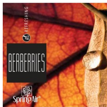
Náplň do velkoprostorového osvěžovače Spring Air (CryptoScent) - BERBERRIES (1000ml)