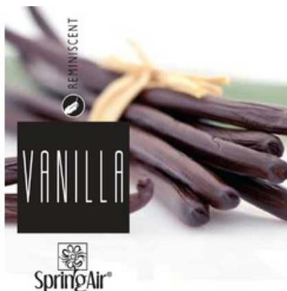
Náplň do velkoprostorového osvěžovače Spring Air (CryptoScent) - VANILLA (1000ml)