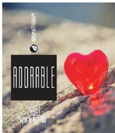
Náplň do velkoprostorového osvěžovače Spring Air (CryptoScent) - ADORABLE (1000ml)