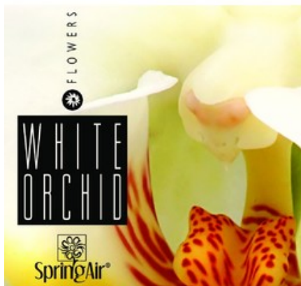
Náplň do velkoprostorového osvěžovače Spring Air (CryptoScent) - WHITE ORCHID (1000ml)