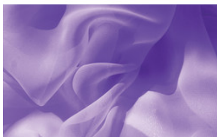
Náplň do velkoprostorového osvěžovače Spring Air (CryptoScent) - SILK (1000ml)