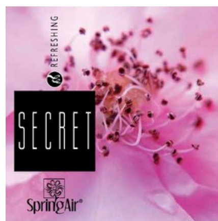
Náplň do velkoprostorového osvěžovače Spring Air (CryptoScent) - SECRET (1000ml)