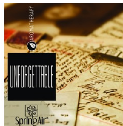
Náplň do velkoprostorového osvěžovače Spring Air (CryptoScent) - UNFORGETTABLE (1000ml)