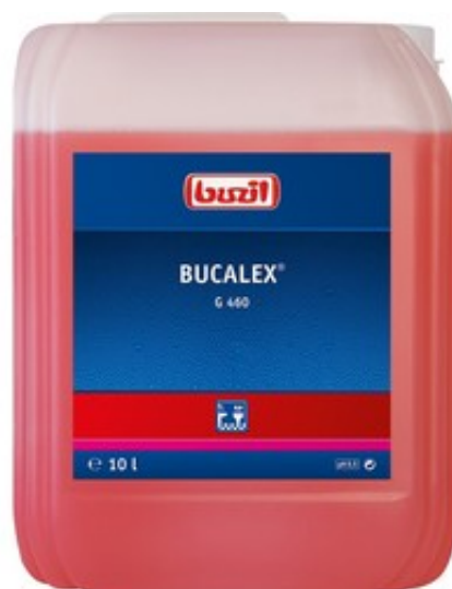
Buzil Bucalex G 460 (10L)