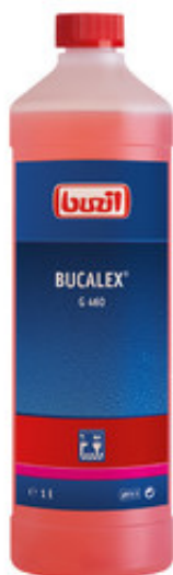
Buzil Bucalex G 460 (1L)