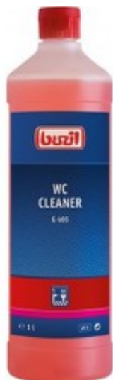
Buzil WC Cleaner G 465 (1L)