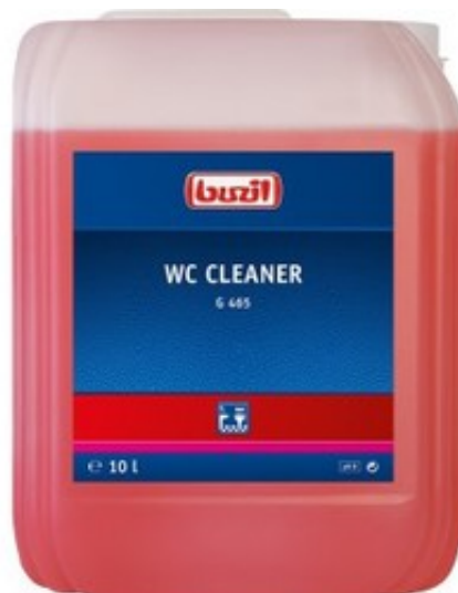
Buzil WC Cleaner G 465 (10L)