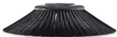
Boční kartáč pro zametací stroje Nilfisk 109x315mm PPL 0,5