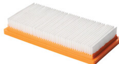
Polyesterový panelový filtr pro zametací stroje Nilfisk SW900 a Floortec 760