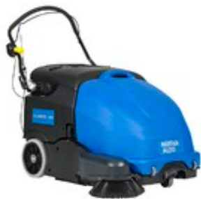
Nilfisk FLOORTEC 760 B