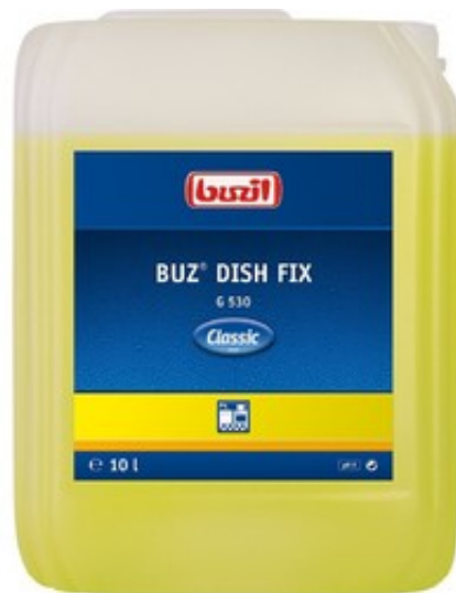
Buzil Buz Dish Fix G 530 (10L)