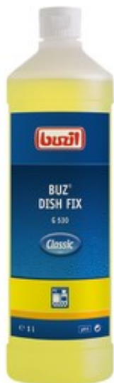
Buzil Buz Dish Fix G 530 (1L)