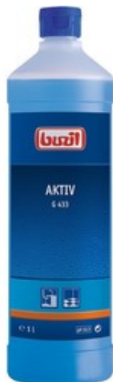
Buzil Aktiv G 433 (1L)