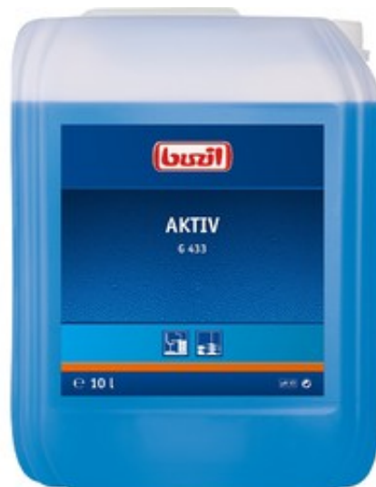
Buzil Aktiv G 433 (10L)