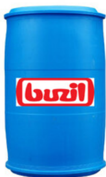
Buzil Perfekt G 440 (200L)