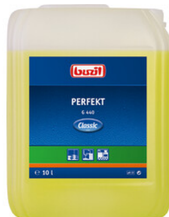
Buzil Perfekt G 440 (10L)