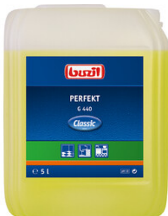
Buzil Perfekt G 440 (5L)