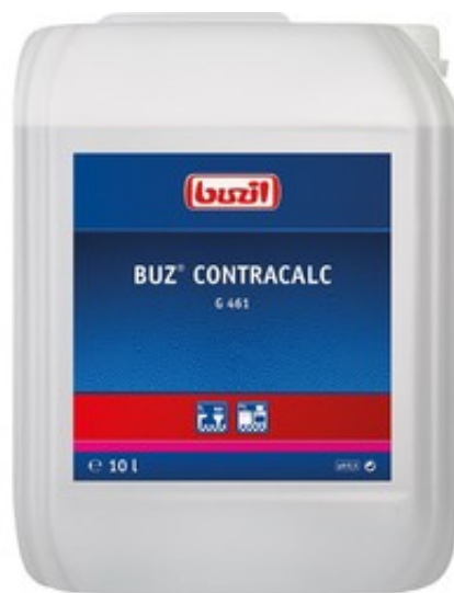
Buzil Buz Contracalc G 461 (10L)