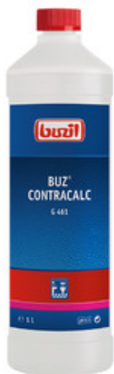
Buzil Buz Contracalc G 461 (1L)