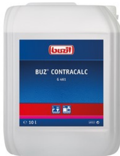
Buzil Buz Contracalc G 461 (10L)