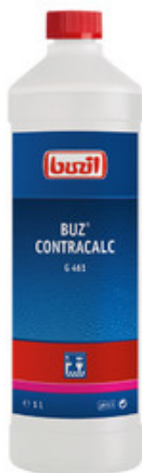
Buzil Buz Contracalc G 461 (1L)