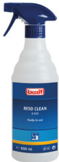
Buzil Reso Clean G 515 (600ML)