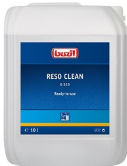
Buzil Reso Clean G 515 (10L)