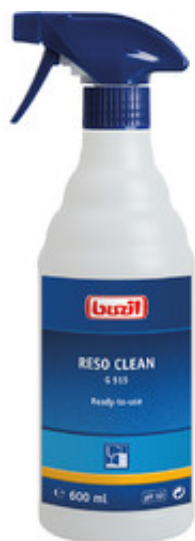
Buzil Reso Clean G 515 (600ML)