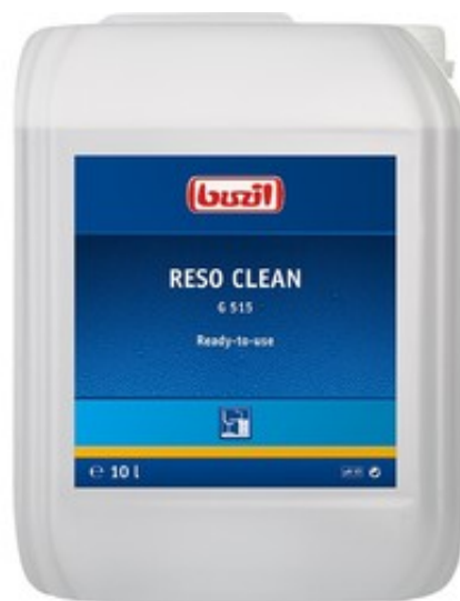
Buzil Reso Clean G 515 (10L)