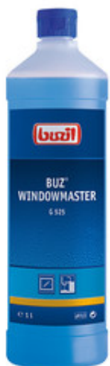
Buzil Buz Windowmaster G 525 (1L)