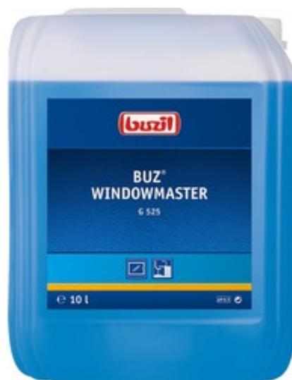
Buzil Buz Windowmaster G 525 (10L)