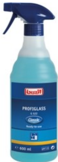
Buzil Profiglass G 522 (600ML)