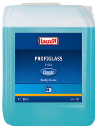
Buzil Profiglass G 522 (10L)