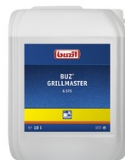
Buzil Grillmaster G 575 (10L)