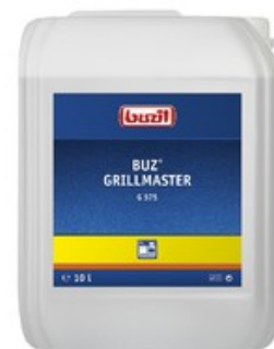
Buzil Grillmaster G 575 (10L)