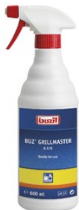
Buzil Buz Grillmaster G 576 (600ML)