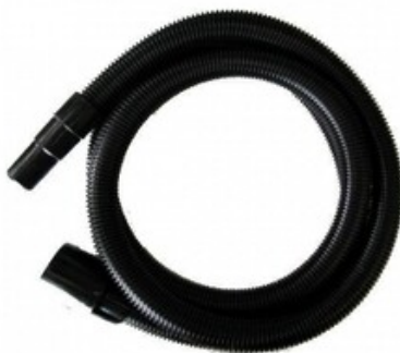
Gisowatt sací hadice včetně koncovek pro vysavače DN 25 x 3m