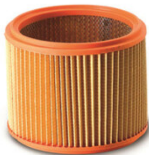
Filtrační patrona - válcový filtr Gisowatt PC 20 - PC 35