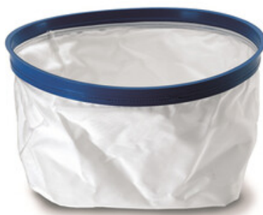
Filtrační vak Gisowatt PC 35 - PC 50 Plastic