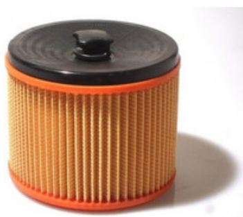
Filtrační patrona - válcový filtr s držákem Gisowatt PC 20 - PC 35