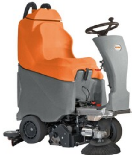
TSM Grande Brio Ride ON 75-C62 (2 postranní kartáče)