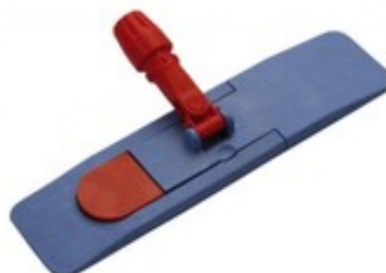
Držák mopu magnetický 50 cm - pro kapsové mopy