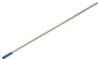
Tyč ALU 1400 mm, pr. 23.5 mm