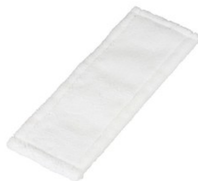
MikroMop bílý 50 (kapsový)