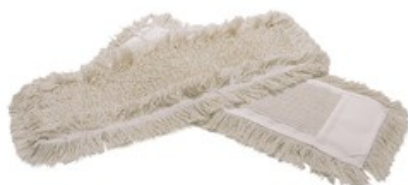
Mop kapsový 50 cm