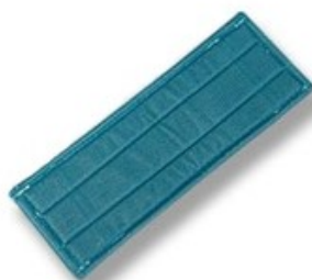
Kartáčový Mop zelený 50 (kapsový)