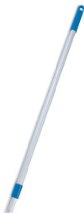
Tyč teleskopická k držáku mopu 80-160cm