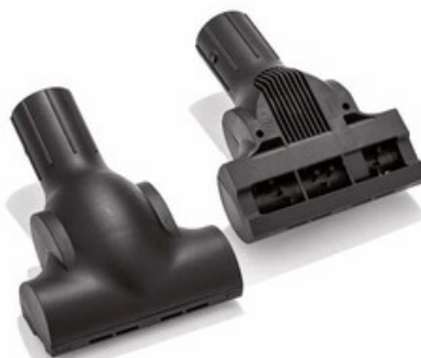
Rotační podlahová hubice TB155 pro vysavače DN36 (155mm)