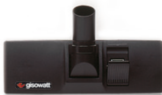
Podlahová kombi hubice Gisowatt DN36