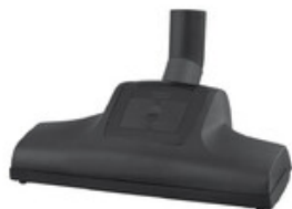
Rotační podlahová hubice TK286 pro vysavače DN36